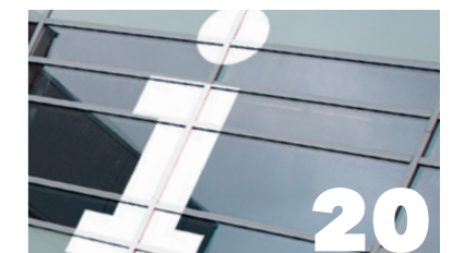
Algemene informatie O.A. NIVEAUS, LEERWEGEN, TOELATINGSEISEN