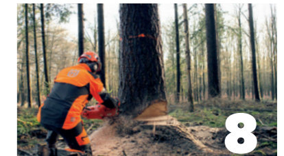
European Treeworker/ Boomverzorger BBL, NIVEAU 3