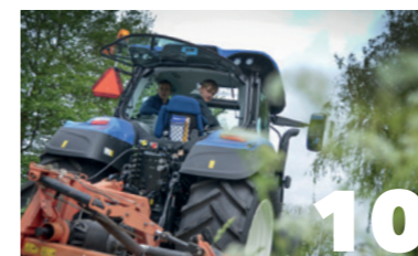
Groen, Grond & Infra BBL, NIVEAU 2, 3