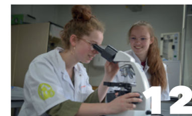
Dierenartsassistent- Paraveterinair BOL, NIVEAU 4+