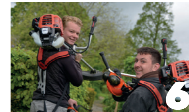
Hovenier BOL/BBL, NIVEAU 2, 3, 4