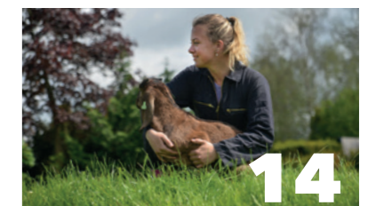
Diervverzorging BOL, NIVEAU 2, 3, 4