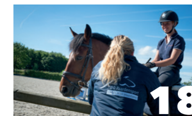
Paardensport BOL, NIVEAU 4+