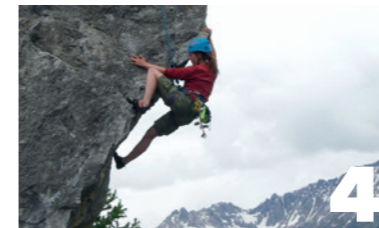
Outdoor Activities BOL, NIVEAU 3, 4

Lentiz | MBO Maasland vindt het belangrijk dat haar studenten internationale ervaring opdoen. Door onze vele interessante internationaliseringsprojecten kan elke student via stage of een keuzedeel een buitenlandse ervaring opdoen. Stage lopen is een leuke en leerzame tijd tijdens je opleiding. Als je dan ook nog de stage in het buitenland kunt doen, dan wordt het echt een onvergetelijke tijd! Bovendien kunnen studenten die kiezen voor een buitenlandse stage binnen Europa een deel van de kosten vergoed krijgen via subsidie van Erasmus+ studentenmobiliteit.