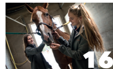
Paardenhouderij BOL, NIVEAU 3, 4