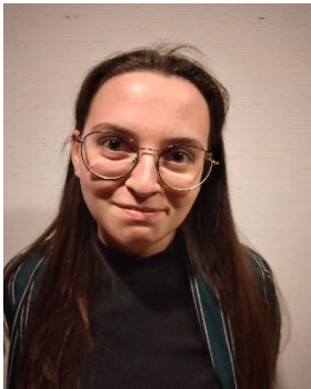
Floor Aster – echtgenote