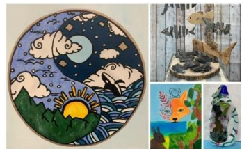
Examenwerk 2022, thema Natuur