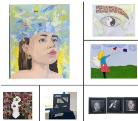
Schoolonderzoek 2023, thema identiteit

Als je dit vak kiest moet je twee examens doen; een praktijkexamen én een theorie-examen. Uiteraard oefenen we in de lessen voor zowel de theorie als de praktijk. Tijdens het theorie examen krijg je een boekje met afbeeldingen van kunstwerken waar je vragen over krijgt. Je moet bijvoorbeeld kunnen vertellen welke trucs en technieken de kunstenaar gebruikt heeft bij het maken van het kunstwerk, wat de verschillen en overeenkomsten zijn tussen twee kunstwerken, of welke onderdelen van het kunstwerk goed de betekenis benadrukken. Je moet goed kijken naar kunst en goed kunnen vertellen wat je ziet.